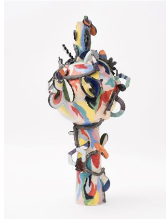
Milena Muzquiz Pineapple Express, 2018, Keramik, glasiert, 69 × 46 × 44 cm © Milena Muzquiz, Courtesy of Travesía Cuatro

MAKE OR BREAK 16 MAI–31 JUL, 2026 ERÖFFNUNG: 15 MAI 2026, 18 – 21 UHR